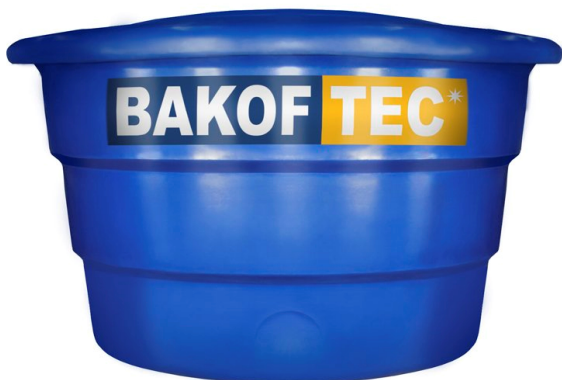
Figura 2 - Reservatório de Polietileno