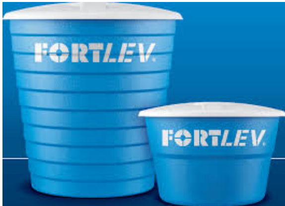
Figura 1 - Reservatório de Fibra de Vidro

devido a algumas vantagens que apresentam em relação aos demais reservatórios: menor acúmulo de sujeira (devido a sua superfície interna lisa), mais leves, encaixe preciso das tubulações, facilidade de transporte, instalação e manutenção, e ocupam menor espaço.