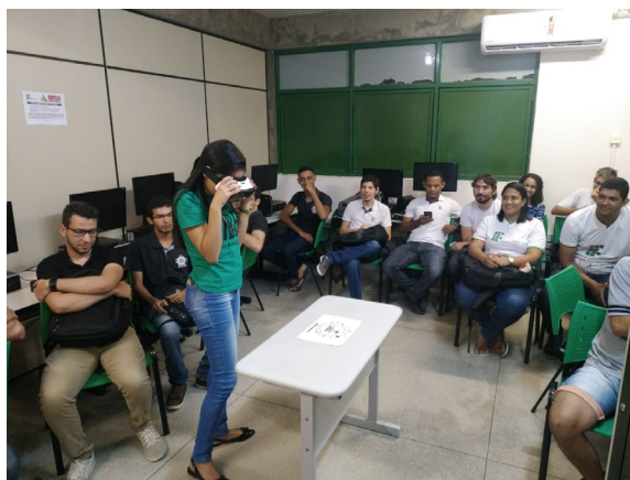
Imagem 5 - Momento de interação com o uso da Realidade Aumentada na sala de aula do nível superior.

No âmbito científico, o método pode ser classificado como hipotético dedutivo, no qual o pesquisador, ao identificar um problema, formula uma hipótese e a submete a testes que comprovam a sua veracidade. A hipótese levantada é de que as tecnologias de realidade virtual e aumentada podem impactar positivamente no processo de ensino-aprendizagem na educação básica. Para confirmar essa hipótese, foi realizada uma ampla revisão bibliográfica sobre o tema, bem como proposto o desenvolvimento de aplicativos na área e alguns testes com alunos em sala de aula, no ensino superior e fundamental.