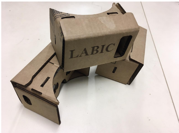
Imagem 4 - Google Cardboards desenvolvidos em cortadora CNC laser.